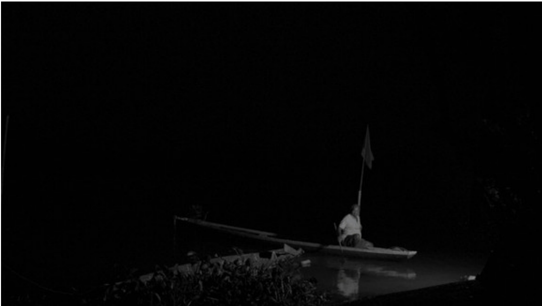
숨 수파파린야, '달의 양면'. 비디오 설치, 싱글채널 비디오, 5.1 사운드 시스템, 흑백, 31분 15초. 2021.

다대포해수욕장 모래사장 위에 설치된 컨테이너 박스에 들어가면 태국 치앙마이 기반으로 활동하는 숨 수파파린야 작가의 'Two Sides of the Moon(달의 양면)'(2021) 다큐멘터리 영상 작품을 만날 수 있다. 달의 양면은 2024 방콕 비엔날레를 비롯한 주요 전시에서 선보였다.