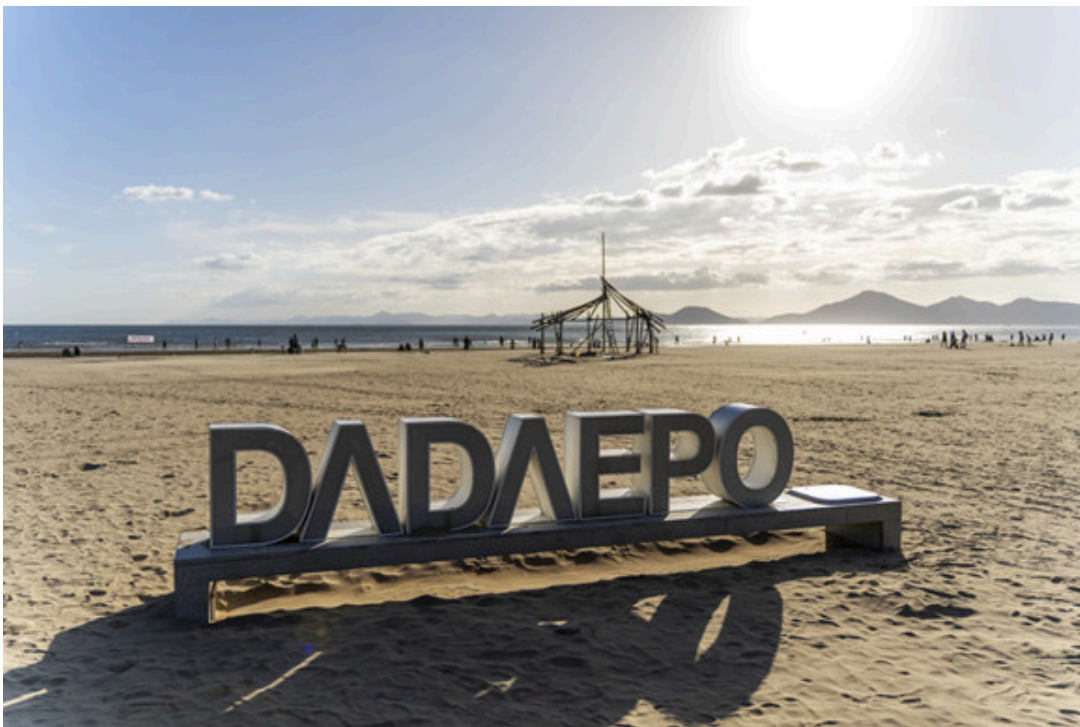
2025 바다미술제 전시장소 다대포해수욕장 전경.

작가는 태국 발전청이 관리하는 두 장소를 기록한 ‘필요가 지구를 움직일 때(When Need Moves the Earth)’(2014)에서도 칸차나부리 주 스리나가린 댐의 터빈실, 통제실, 변압기 등을 보여줬고, 람팡 주 매모 갈탄 광산의 육체노동과 폭발음을 들려줌으로써 환경적인 문제를 다뤘다. 비디오 설치 작품은 ‘도쿄의 열 곳(10 Places in Tokyo)’(2016)에서도 전력 소비량이 많은 곳을 다뤘다.