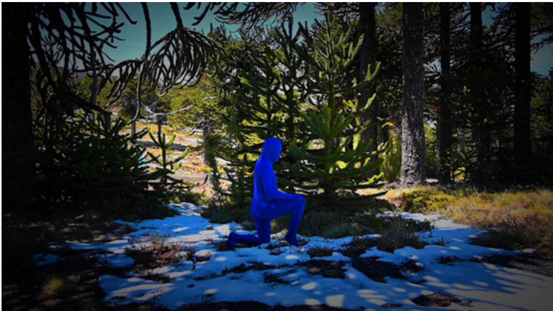
세바 칼푸케오, '죄책감'. 비디오 퍼포먼스, full HD, 9분 11초. 2023.

이 성스러운 의례를 통해 작가는 인간의 신체가 자연 및 생명의 순환과 연결돼 있음을 시사한다. 세바 칼푸케오는 칠레 산티아고에서 태어난 마푸체 출신의 시각 예술가이자 활동가로 설치, 도예, 퍼포먼스, 사진, 비디오 등 다양한 매체를 통해 현대 칠레 사회와 라틴 아메리카에서 마푸체 원주민이 지니는 사회적, 문화적, 정치적 지위에 대해 비판적인 시각을 제시하며, 탈식민주의적 관점을 취한다. 마푸체족 출신이기도 한 작가는 기후변화와 물 부족문제, 사유화되는 점에 대해 꾸준히 발언해왔다.