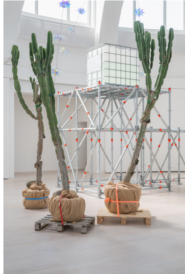
Trevor Young, Underwater Haze, 2025, Detail, Installationsansicht, Kestner Gesellschaft, Courtesy the artist, Foto: Volker Crone