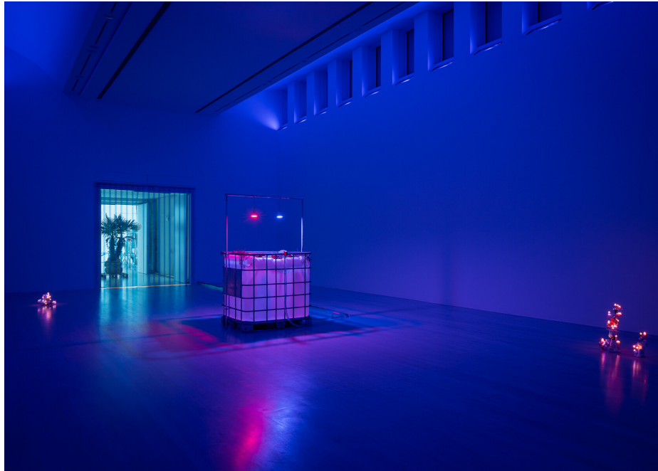
Trevor Young, Underwater Haze, 2025, Detail, Installationsansicht, Kestner Gesellschaft