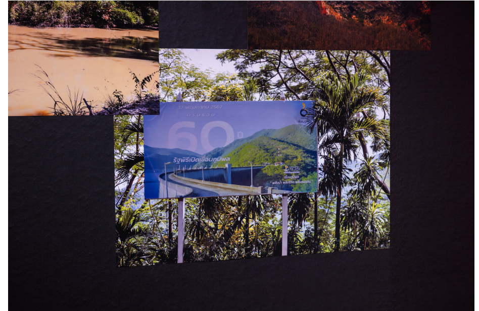
Som Supaparinya, The Rivers They Don't See, 2025, Installationsansicht, Kestner Gesellschaft, Courtesy the artist, Foto: Volker Crone