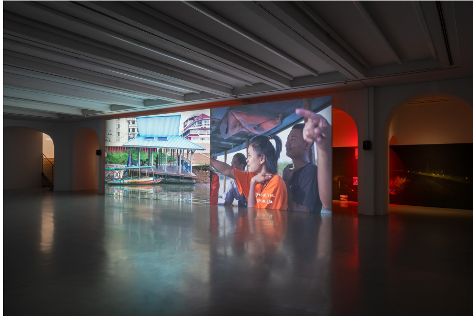
Som Supaparinya, The Rivers They Don't See, 2025, Installationsansicht, Kestner Gesellschaft, Courtesy the artist, Foto: Volker Crone